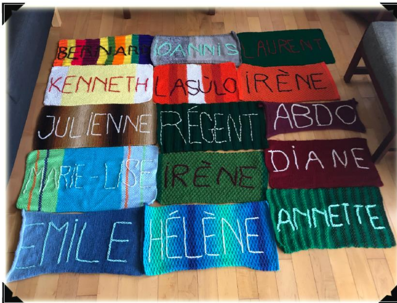
Parmi les 251 prénoms, brodés sur les foulards, de personnes aînées décédées au printemps 2020 dans les CHSLD du Sud-Ouest-Verdun