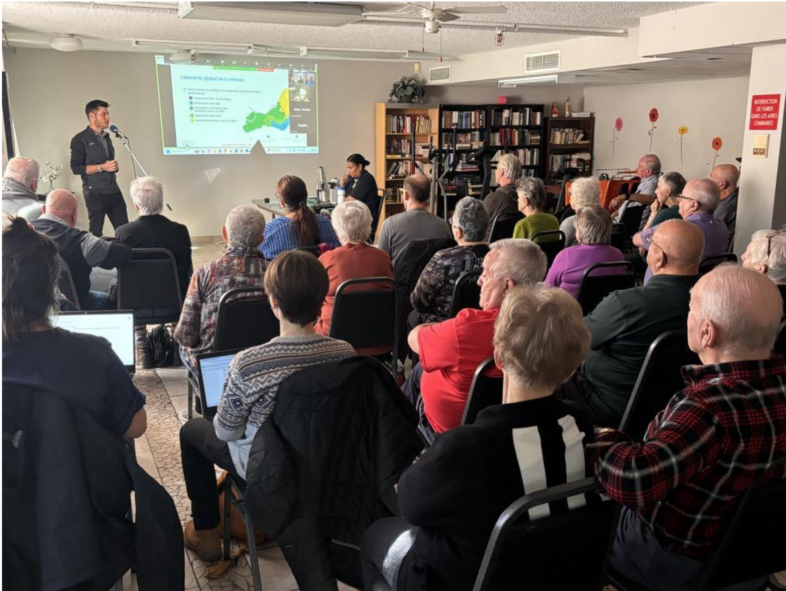
ZOOM Aîné.e.s En Tournée à la Résidence Hormidas-Delisle à St-Henri sur le thème de la refonte STM